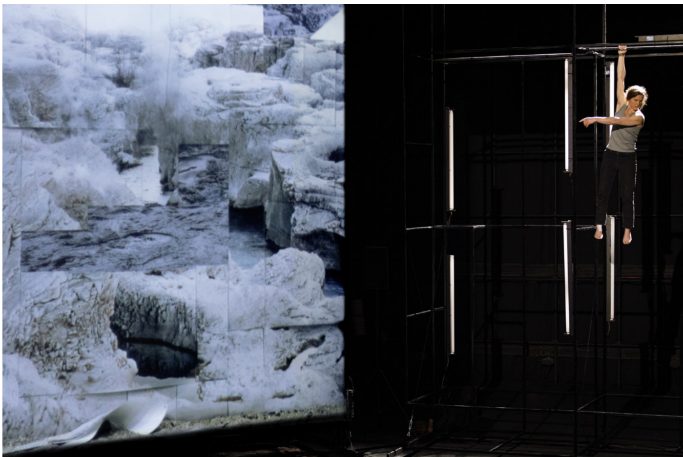
ANIMA , Parvis Saint-Jean (Dijon)