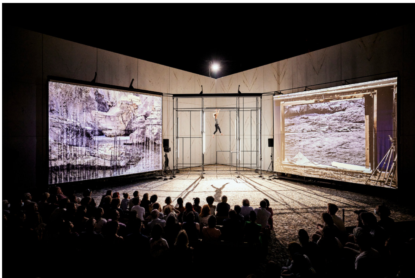
ANIMA , Collection Lambert (Avignon)