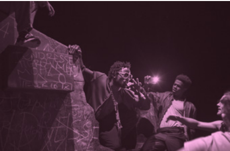
La Tendresse