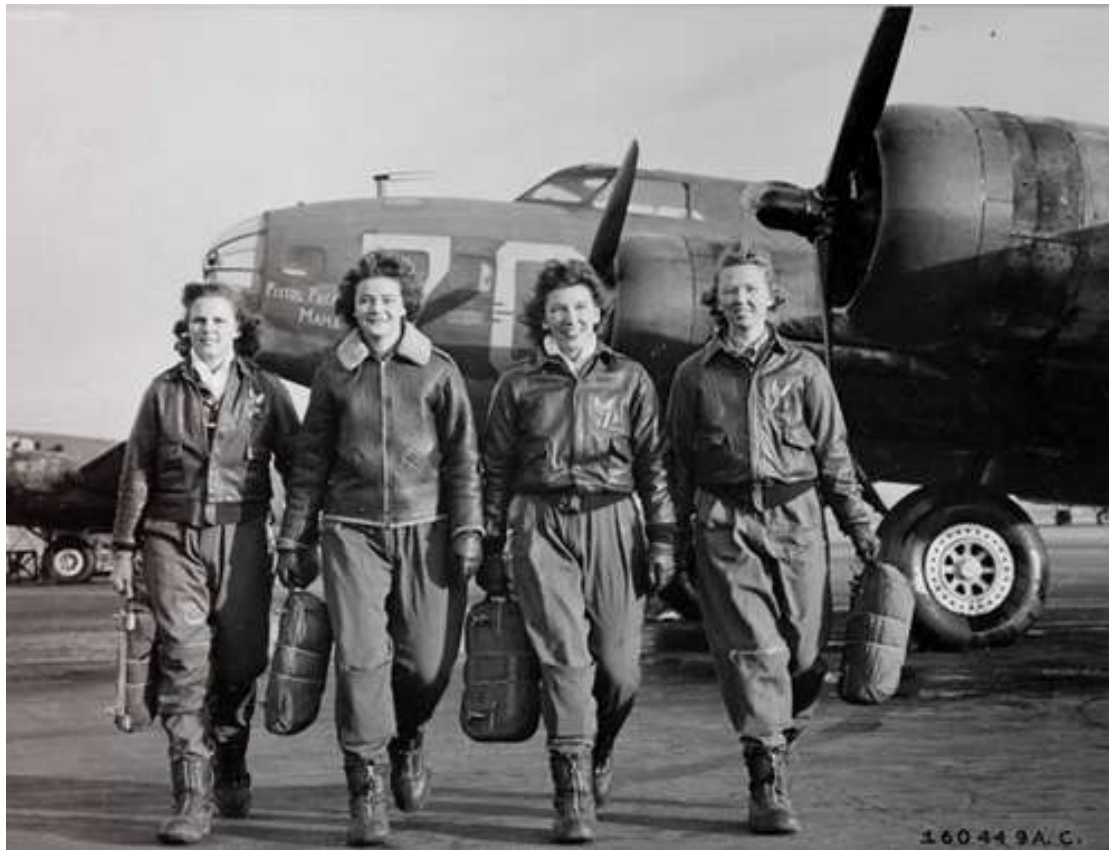
Pilotes faisant partie du WASP, Women Airforce Service Pilots, puis du programme Mercury 13, 1944