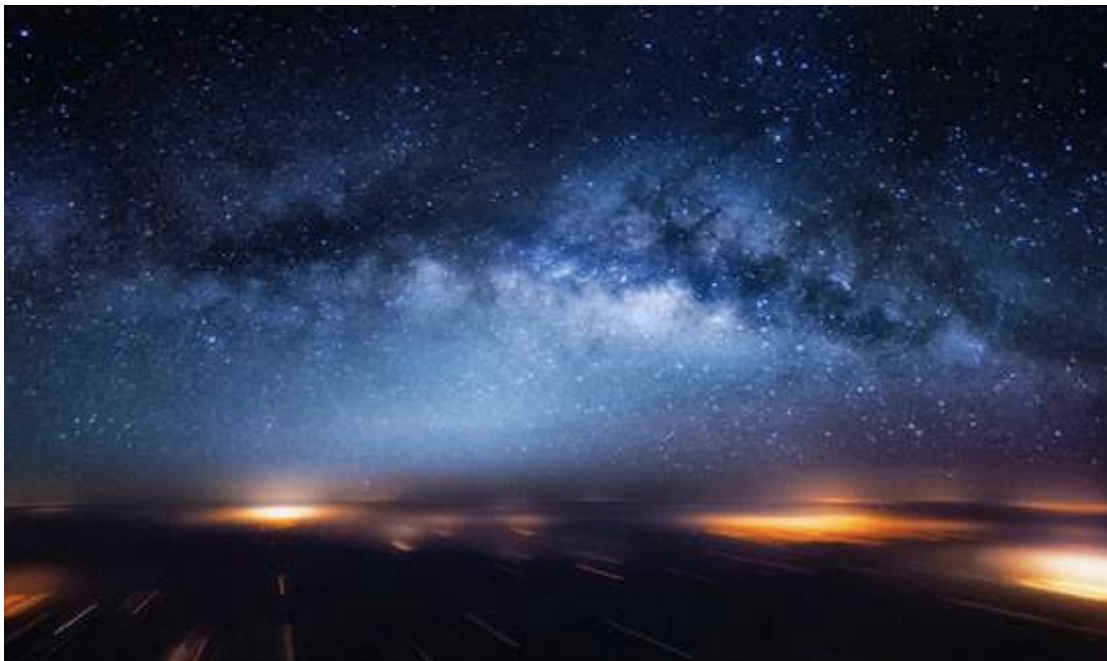
La voie lactée au-dessus des métropoles indiennes

Vivre avec le trouble , Donna Haraway, 2016