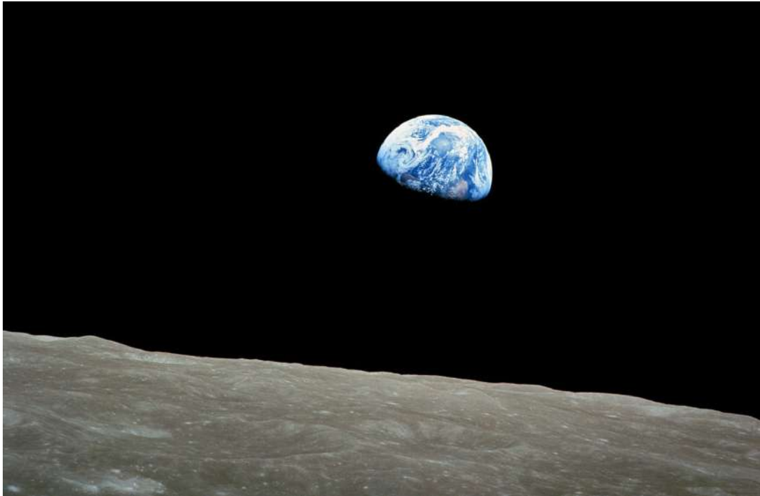
Earthrise , 1968

S'inscrire dans l'espace-temps de l'univers c'est sortir d'un espace-temps de terrien-ne, d'un espace-temps de mortel-le, c'est se placer dans la relativité de la matière dont nous venons et où nous retournerons. C'est s'inscrire dans un cycle bien plus large que celui de notre existence et changer de perspective sur nos destins humains. Ce que l'on perçoit comme le réel du temps et de l'espace n'est plus. Cela permet un nouveau regard, un espace de liberté.