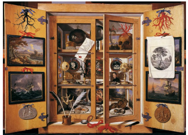
Cabinet de curiosité, Andrea Domenico Remps - A Cabinet of Curiosity , 1690s.