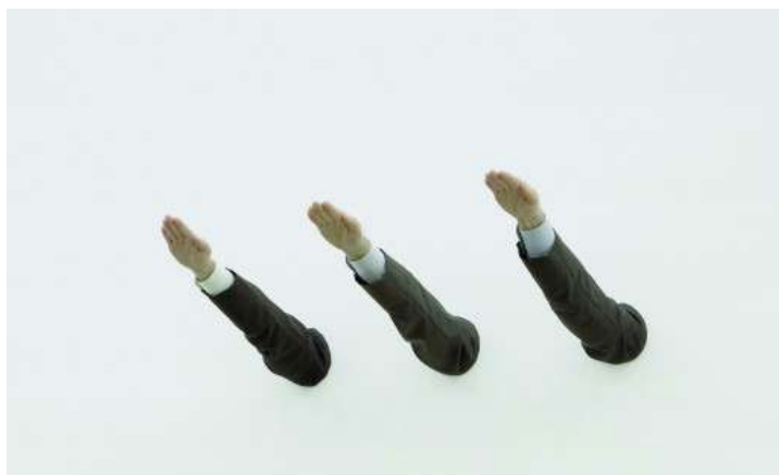
© Maurizio Cattelan, Ave Maria 2007