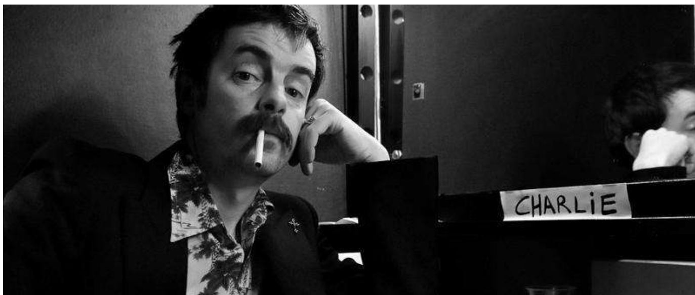
Tout Dostoïevski

Faire la connaissance de Charlie et de son univers. Voir les liens vidéo ci-dessous (Ressources). À partir de ces vidéos, tenter de définir le personnage de Charlie.