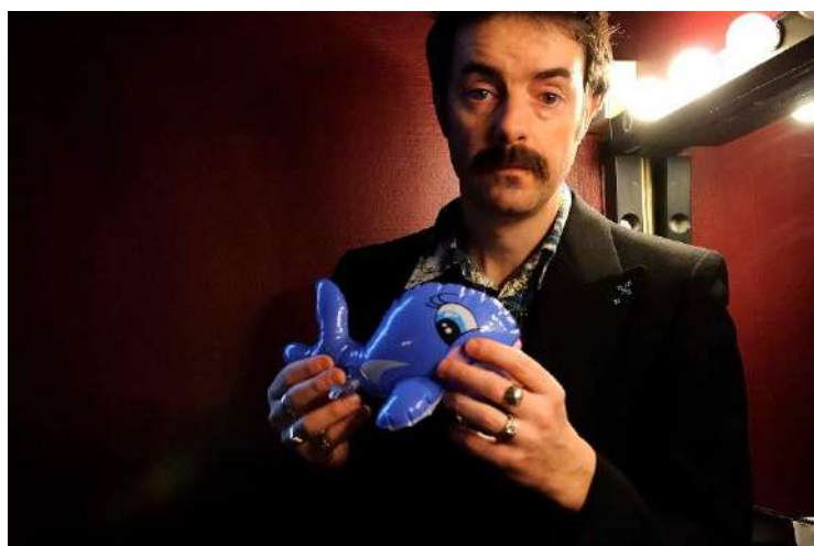
Tout Dostoïevski