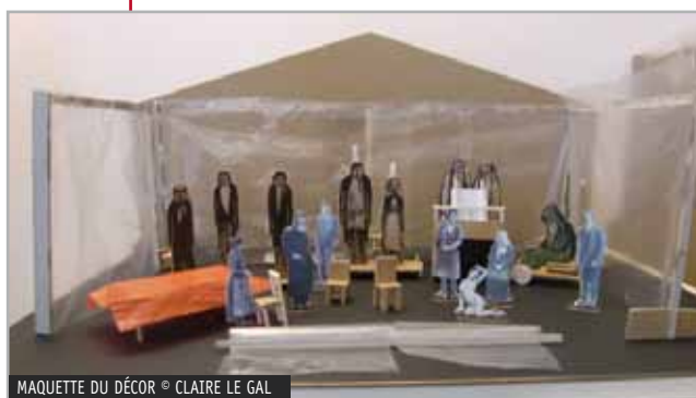
MAQUETTE DU DÉCOR © CLAIRE LE GAL

→ Repérer les objets, accessoires, éléments qui ont une fonction dramatique ou symbolique importante et qu'il pourrait être pertinent de faire figurer sur scène.