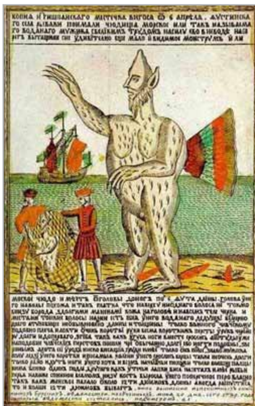
EXEMPLE DE LOUBOK

Un espace, des personnages, une action: l'affiche est en elle-même un véritable matériau dramatique. Comme une miniature de la pièce.