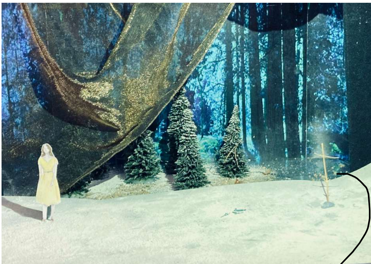
Scène du cimetière