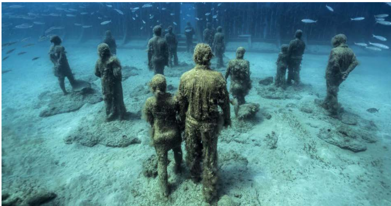
Crossing the Rubicon, Lazarote, Spain (site du sculpteur)