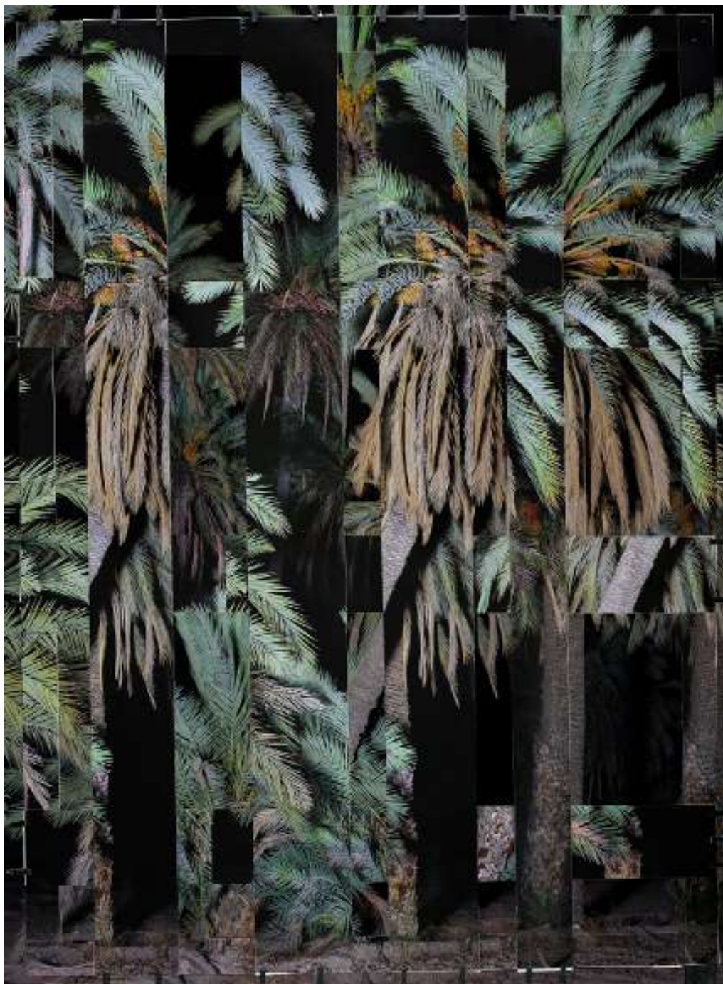
Noémie Goudal, Post Atlantica, Phoenix VI , 2021, 200 x 149,4 cm.