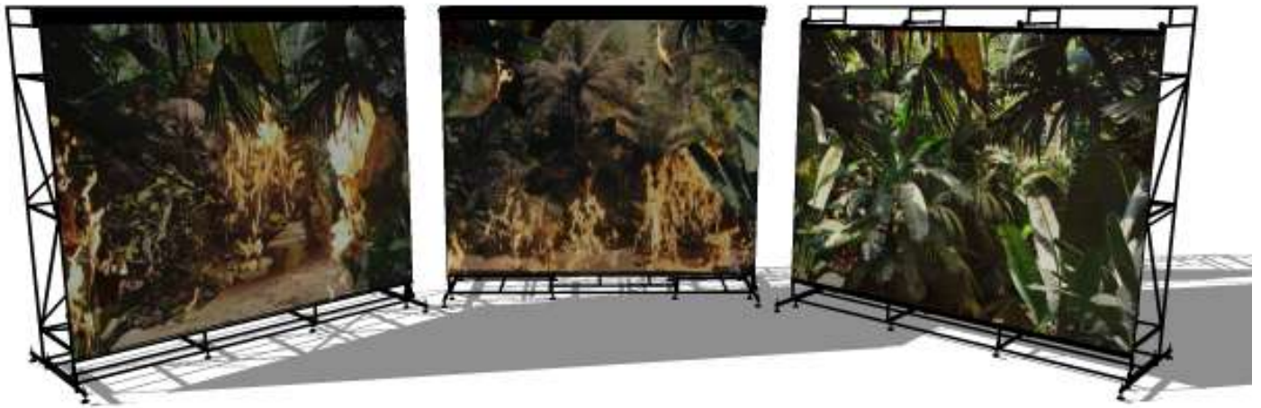
Maquette de la scénographie d'ANIMA, 2022

Scénographie Hélène Jourdan / Image : Noémie Goudal, Below the Deep South , 2021, Film, 11:34