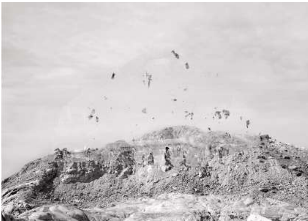
Noémie Goudal, Démantèlement I (extrait), 2018