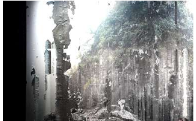
Décors scénographiques, dissolution par l'eau d'une photographie imprimée, The Lover , Noémie Goudal, 2015