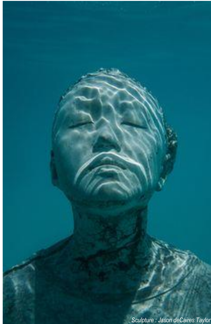
Sculpture : Jason deCaires Taylor

« Le visage de l'autre m'interdit de tuer. »