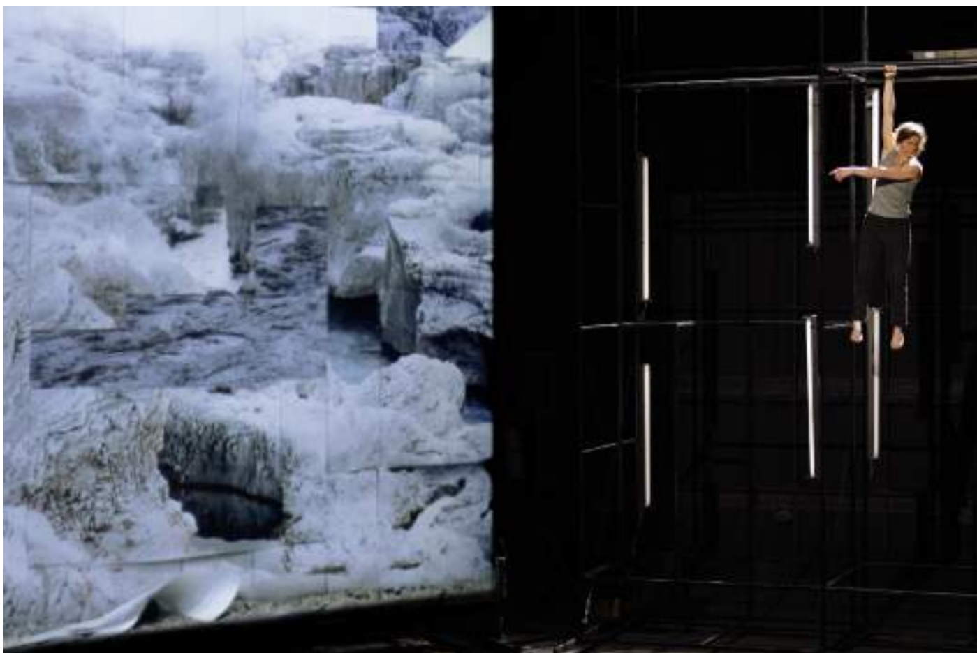
ANIMA , Parvis Saint-Jean (Dijon) © Vincent Arbelet