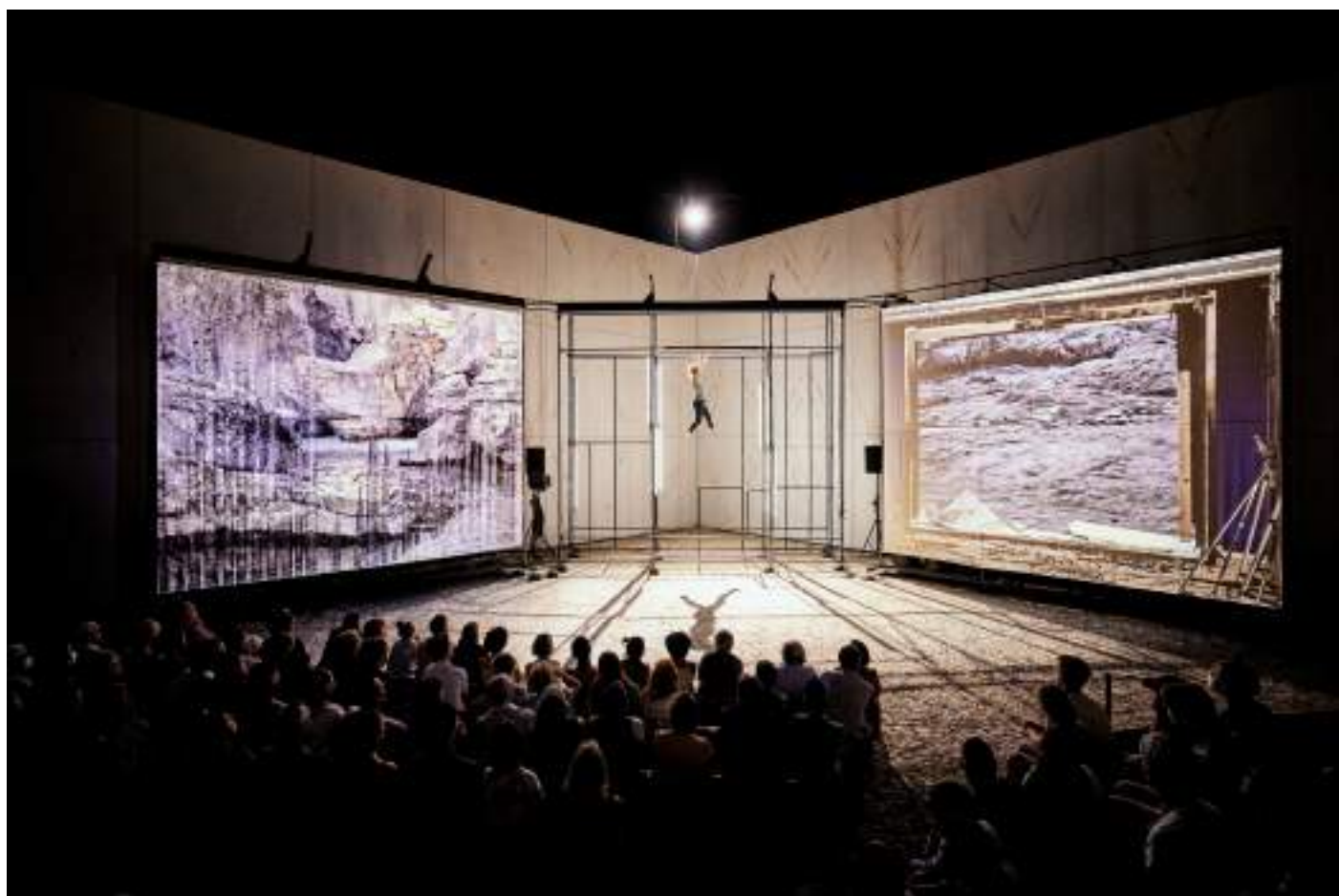
ANIMA , Collection Lambert (Avignon)