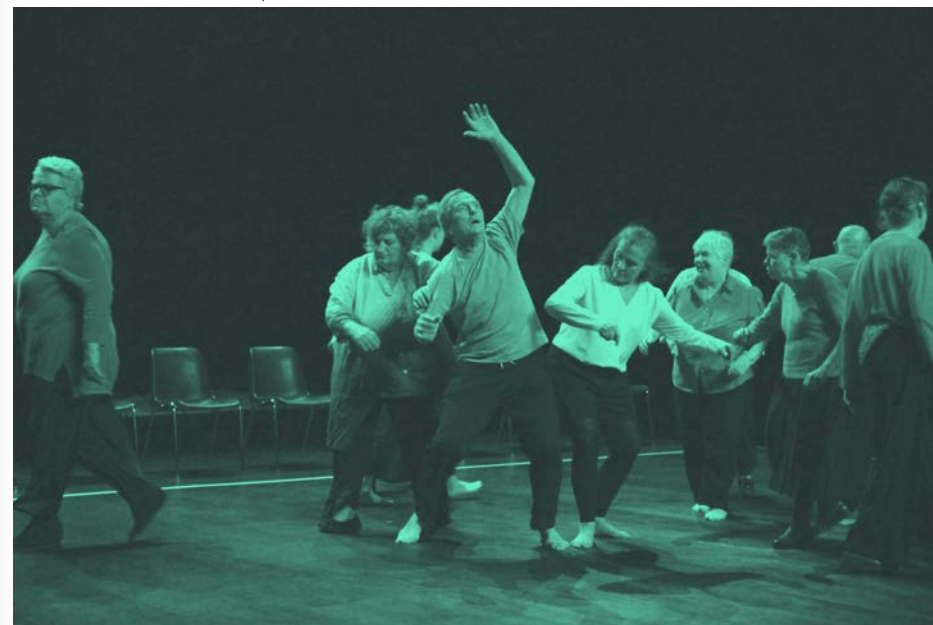
Atelier Modes de vie