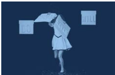
Anaïs Nin au Miroir