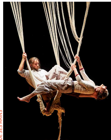
DE SES MAINS

Membre actif du collectif Puzzled de la plateforme jeune public Ile d'Enfance et de Scènes d'Enfance-ASSITEJ, la Compagnie Lunatic est conventionnée par la DRAC Ile de France depuis 2020. Elle est associée au Dunois/Théâtre du Parc - Scène pour un Jardin Planétaire depuis 2019 et à Un Neuf Trois Soleil ! pour la saison 2022-23.