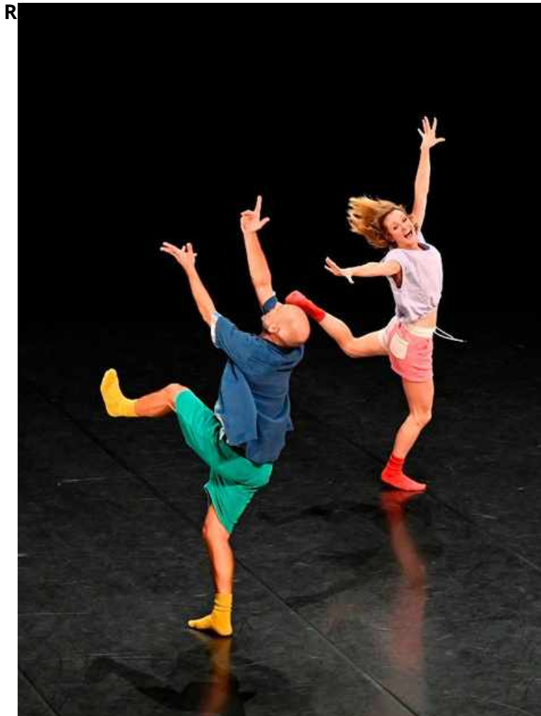
"Boléro" - Gilles Verièpe