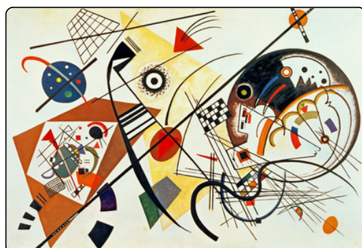
Vassily Kandinsky Lignes intersectantes , 1923

Les œuvres de Schoenberg ont aussi trouvé un écho dans le monde des arts visuels, en particulier chez des artistes comme Wassily Kandinsky , avec qui Schoenberg partageait une conception synesthésique de l'art , où les formes et couleurs visuelles étaient associées à des sons. Les deux artistes étaient influencés par l'idée de libérer l'art de ses contraintes traditionnelles et de créer une nouvelle forme d'expression . L'usage de la couleur et des formes abstraites dans les œuvres de Kandinsky est comparable l'usage des sons de la musique de Schoenberg.