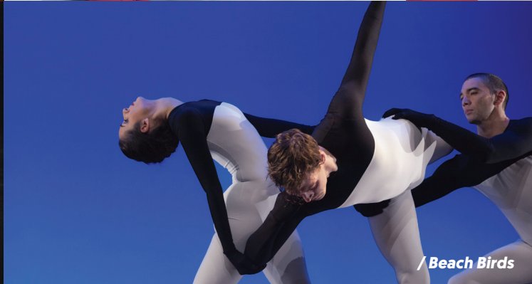
/ Beach Birds