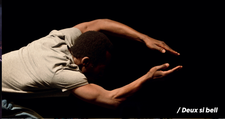
/ Deux si bell