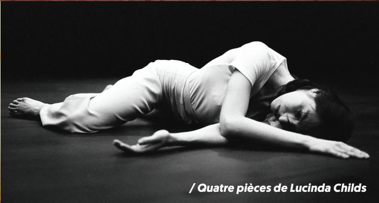
/ Quatre pièces de Lucinda Childs