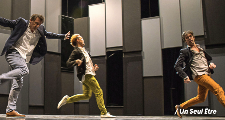
/ Un Seul Être