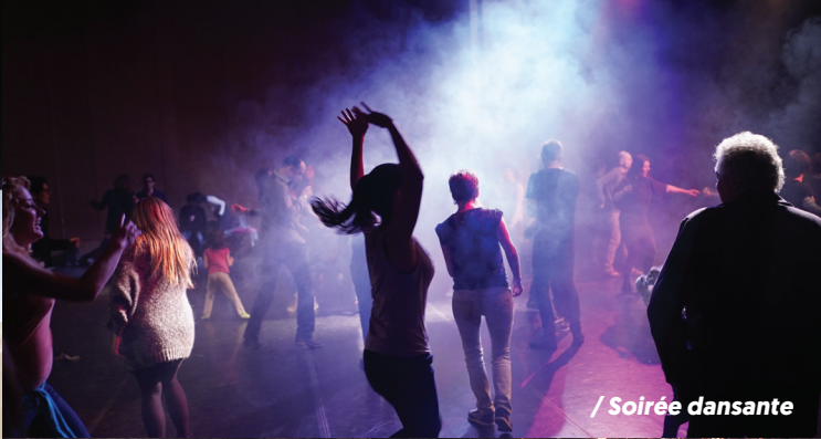
/ Soirée dansante