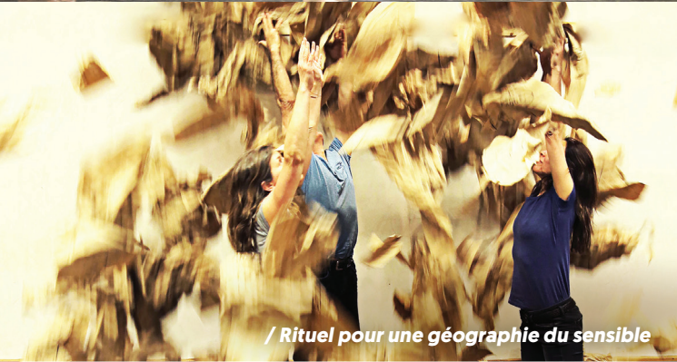
/ Rituel pour une géographie du sensible