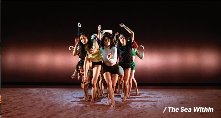
/ The Sea Within