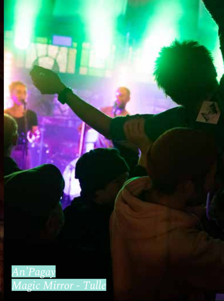
An'Pagay Magic Mirror - Tulle