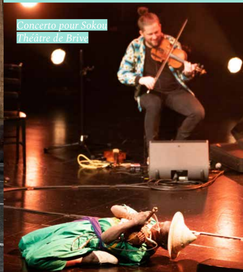
Concerto pour Sokou Théâtre de Brive

Retour sur la 18 ème édition du festival Du bleu en hiver ! Vous avez été près de 2700 spectateurs à assister à l'évènement, MERCI à vous !