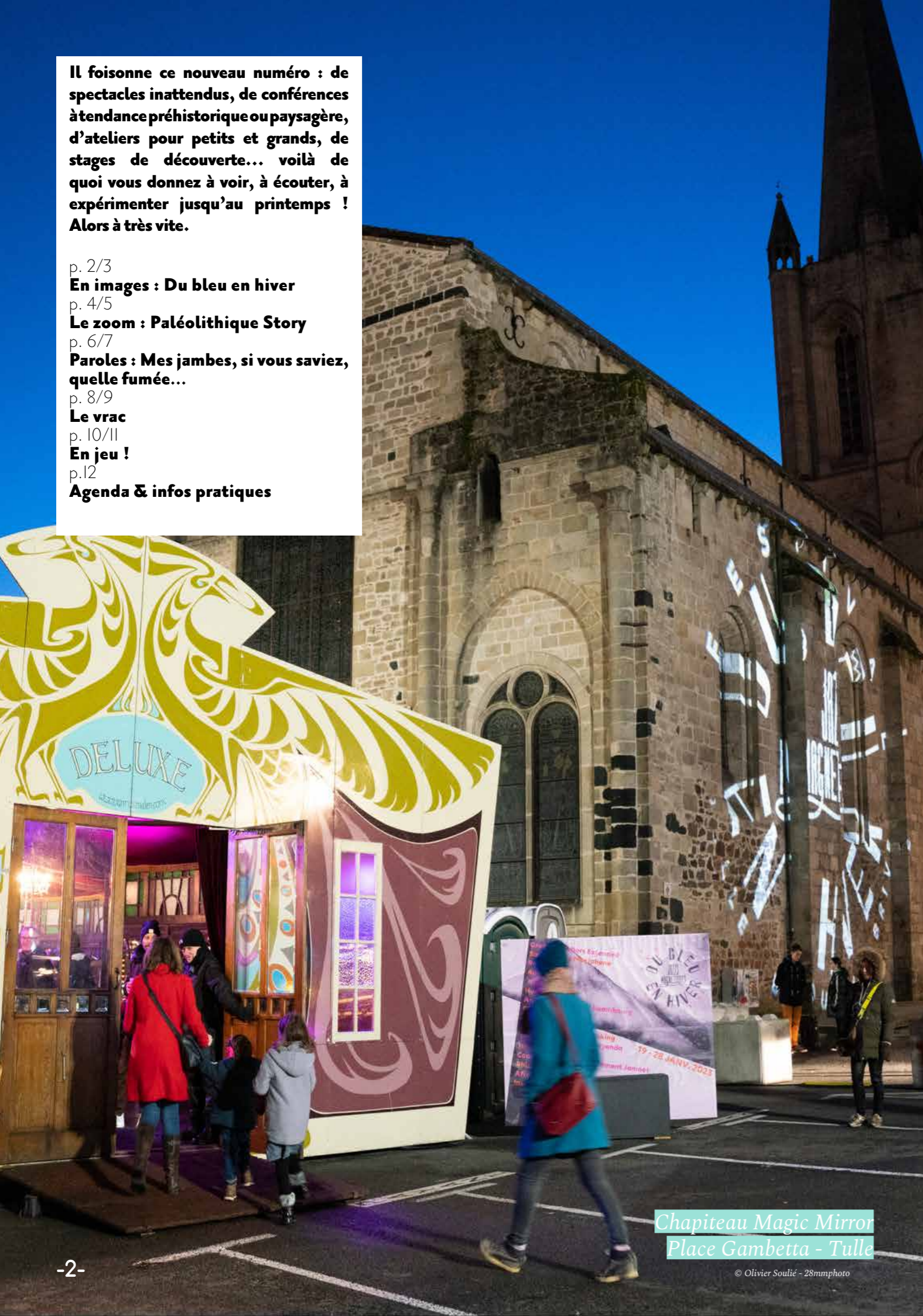
Chapiteau Magic Mirror Place Gambetta - Tulle