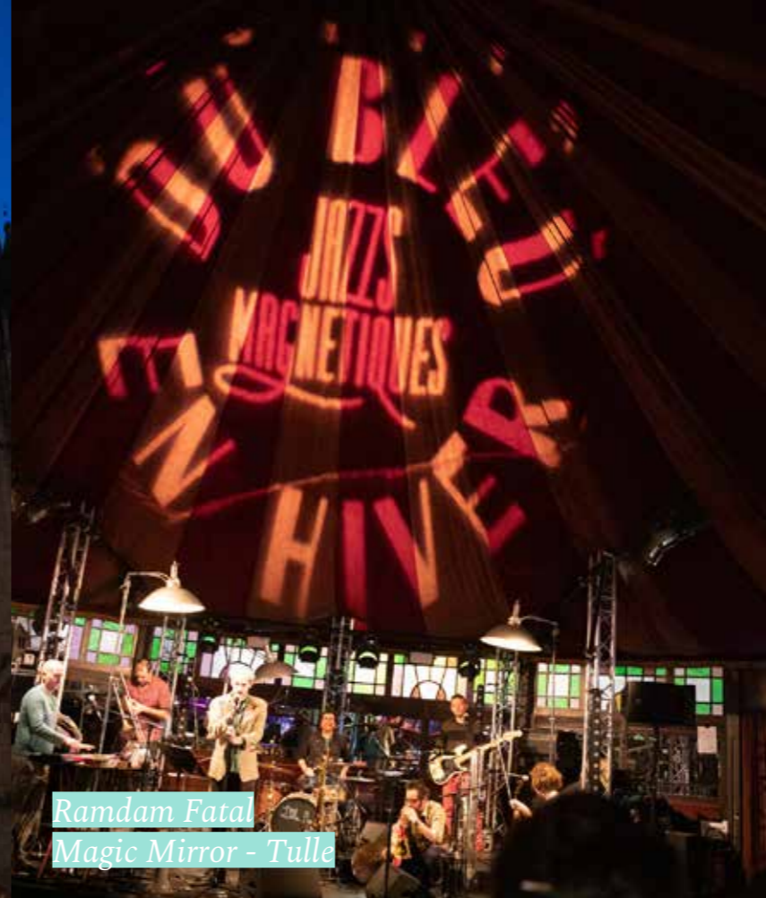
Ramdam Fatal Magic Mirror - Tulle