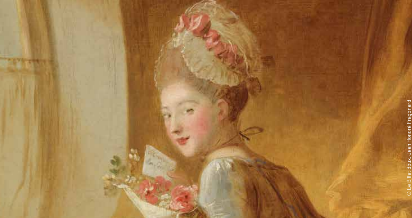
© Le Billet doux, Jean Honoré Fragonard