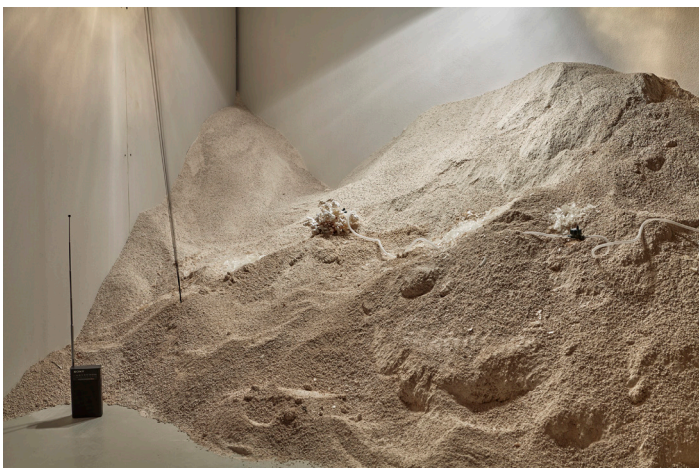
THE CRYSTAL & THE BLIND [PART 2], 2018 Vues de l'exposition