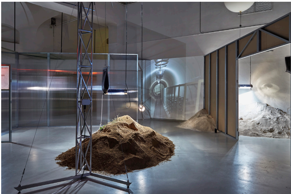
THE CRYSTAL & THE BLIND [PART 2], 2018