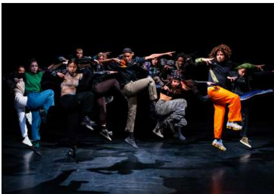
Figure incontournable de la danse contemporaine, Angelin Preljocaj signe un programme composé de trois pièces exceptionnelles. De Vivaldi à Stravinsky, du duo aux pièces d'ensemble, ce triptyque éclectique d'une grande sensualité trace un trait d'union entre le répertoire et la création d'un geste chorégraphique puissant. Une soirée exaltante sublimant l'écriture hors normes du chorégraphe !