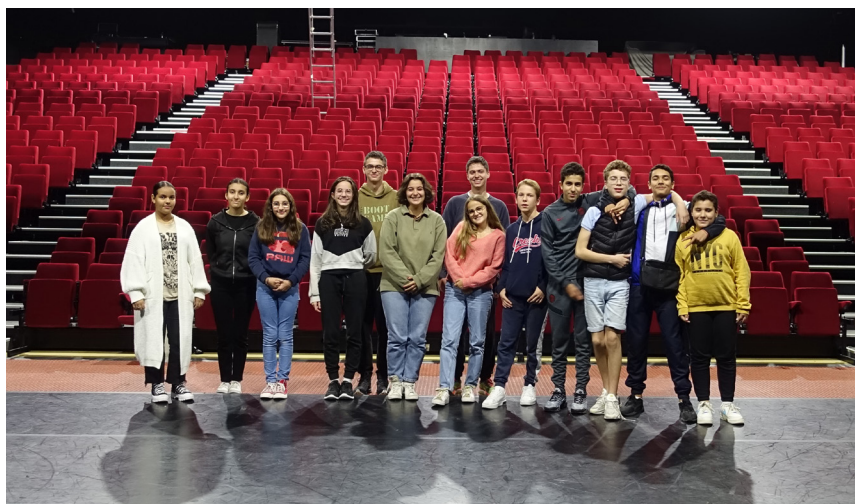
à droite les jeunes de la bande du futur

Parler au présent c'est être lieu de constitution de la mémoire, témoin du quotidien et producteur des idées de demain. Constituer la mémoire en accueillant aussi des pièces de répertoire et notamment en lien avec des programmes scolaires. Chroniquer notre temps en proposant à des équipes d'investir le territoire sur du long terme via des projets créés in situ, à raison d'un par an minimum. Et construire demain collectivement avec les publics.