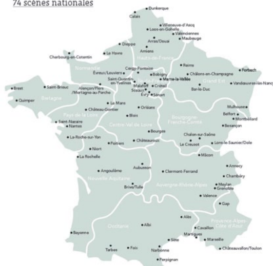
Cartographie des 74 scènes nationales