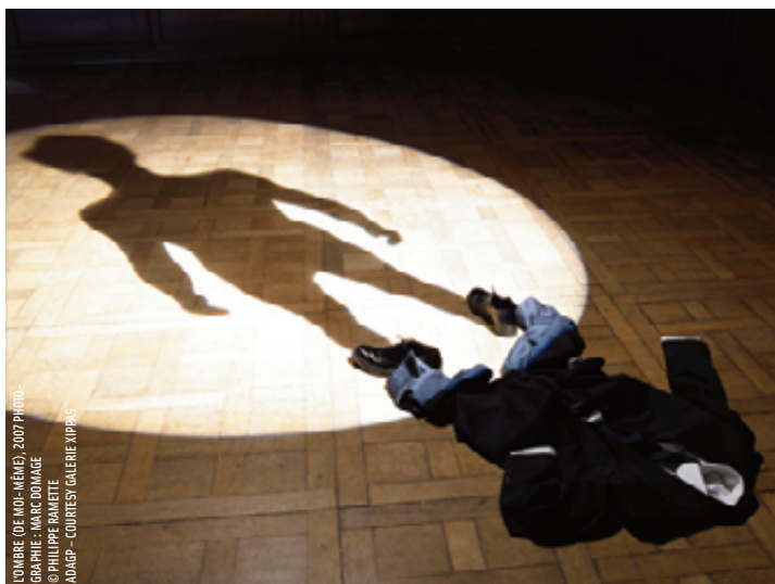
L'OMBRE (DE MOI-MÊME) 2007 PHOTO: GAËLLE - MARC DOMAÏNE © PHILIPPE BIANCHI ADAPTÉ - COURTESY GALERIE XIPRAS

+ Dossier pédagogique disponible sur demande et sur www.espace-des-arts.com