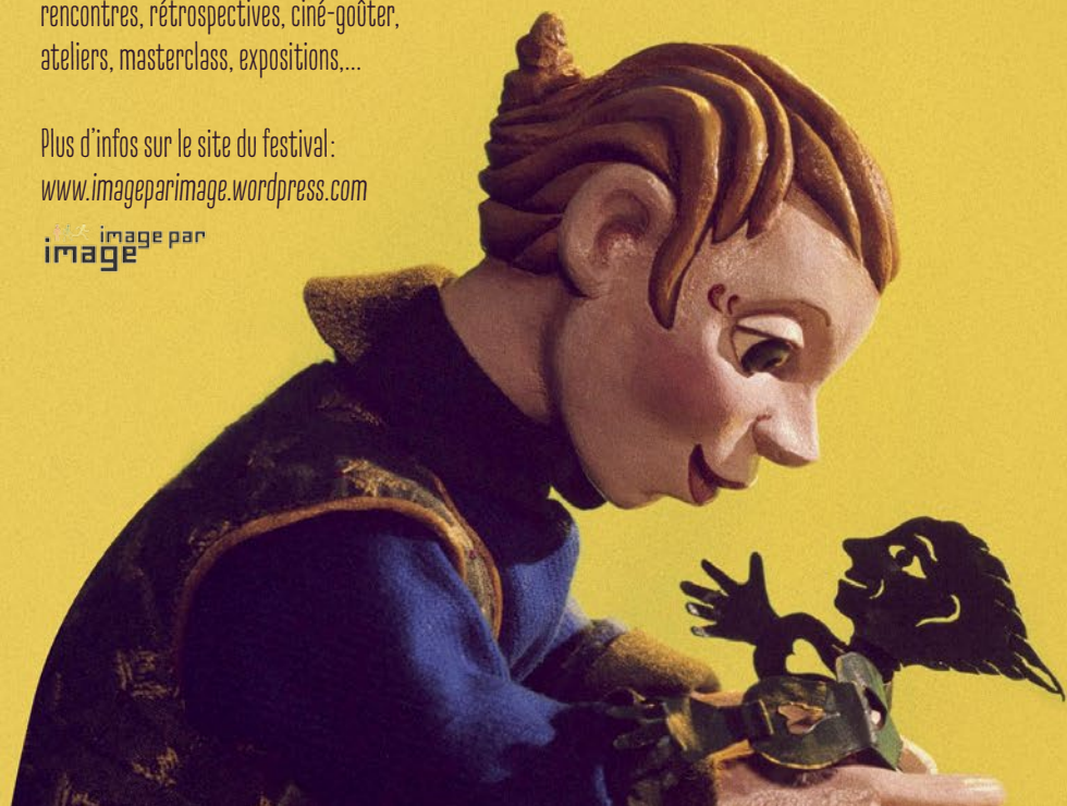
image par image

Plus d'infos sur le site du festival: www.imageparimage.wordpress.com