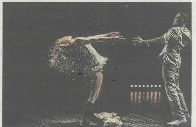
■ La Cie Rasposo a l'art de transformer l'énergie du cirque (fil de fer, acrobaties au sol ou aériennes,) en émotions : ardeurs, colères, délires, passions.

Dévorée par des pulsions contraires, Penthésilée, la reine des Amazones aime Achille et le tua sauvagement. Marie Molliens s'est inspirée de cette guerrière tragique toujours en tension entre la rage de combattre et le désir de s'abandonner, pour écrire et mettre en scène un spectacle de cirque