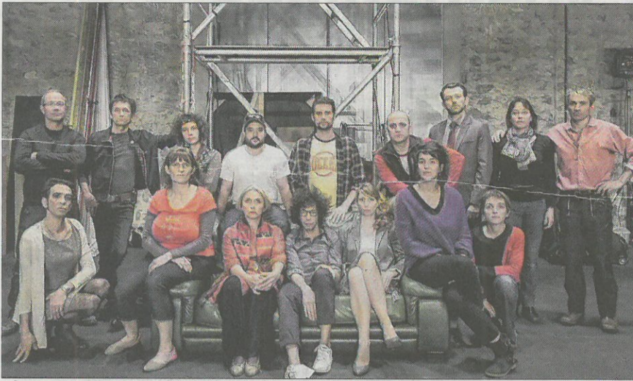
■ À bien y réfléchir... en prétendant montrer la fabrication d'un spectacle de rue, les « 26000 couverts » égratignent le monde du théâtre par la farce, la parodie et une bonne dose d'autodérision.

Pour entamer sa 50 e saison, L'arc Scène Nationale propose de fêter dignement son anniversaire : du 27 au 30 septembre, plusieurs rendez-vous festifs dedans et dehors (gratuits en extérieur) à partager en famille.