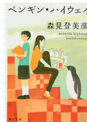
La couverture du roman Penguin Highway de Tomihiko Morimi.

Au Japon, le livre original n'est pas destiné à un public familial mais plutôt adolescent, jeune adulte. Pour sa version animée, il a été décidé de rendre l'histoire plus grand public, c'est pourquoi les équipes artistiques ont mis l'accent sur la qualité de l'animation et l'expression des personnages. Pour les éléments fantastiques, leur apparence a été modifiée, enrichie au fil des croquis. Ensuite ils ont été ajoutés au storyboard, et le colorscrip a été réalisé en écoutant l'avis des membres de l'équipe.