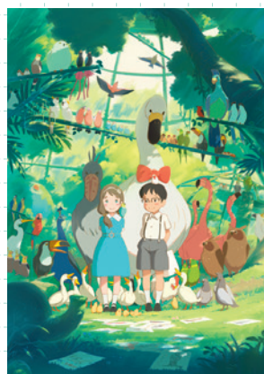
Le court métrage Hinata no Aoshigure , premier projet du réalisateur Hiroyasu Ishida, avec Yojiro Arai au chara-design.