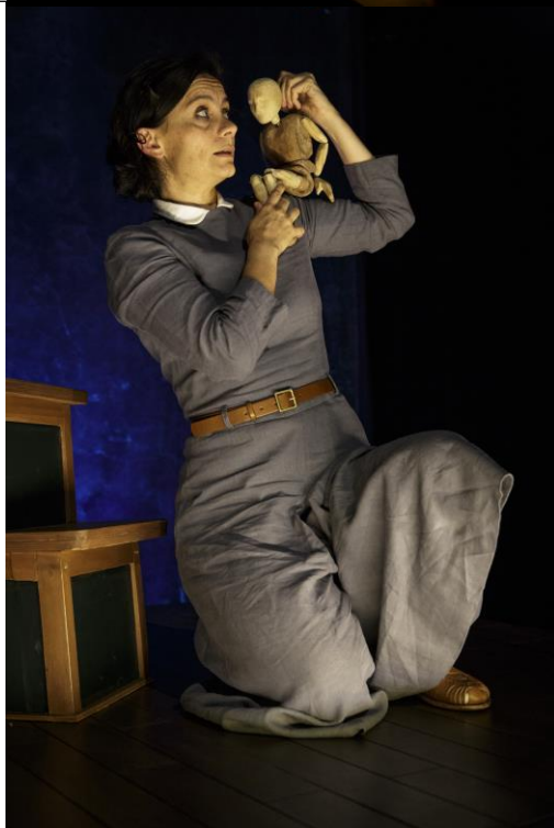
Je ne veux plus