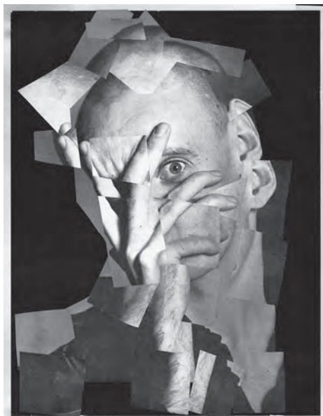
Autoportrait-Photomontage de Jean-Luc Lagarce sur une photographie de Quenneville

Il est évident que je travaillerai peut-être de moins en moins comme metteur en scène, que c'est là que les forces nécessaires viendront le plus à manquer. J'essaie d'envisager un projet à plus long terme sans fin donc, sans inquiétude de l'interrompre, qui pourra dépasser quelque temps l'arrêt du travail sur le plateau. Le squelette, l'architecture de ce projet, son fil conducteur est ce Journal. [...] Cela peut s'achever le plus doucement du monde. Juste une page par-ci, par-là, un mot ou deux.