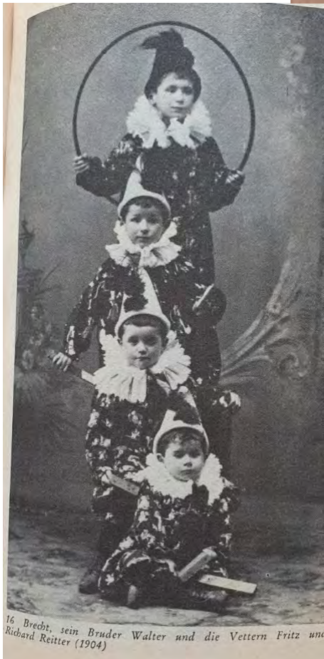
16 Brecht, sein Bruder Walter und die Vettern Fritz und Richard Reitter (1904)