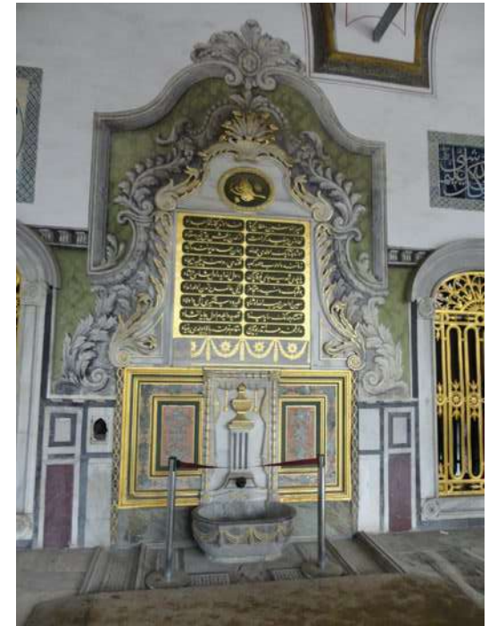
Le palais Topkapi a inspiré les décors du conte.

sans chercher d'unité. Et je n'ai pas voulu rejeter les parents ! Je précise à toutes fins utiles que j'ai eu un très bon père et une très bonne mère, et n'ai donc aucun compte à régler de ce côté-là. Mes héros se révoltent simplement contre une mauvaise autorité ! J'engage les gens à être libres, à refuser de ramper ou d'obéir à des ordres néfastes. Quand je prépare un film, je grappille à droite et à gauche, sans idée préconçue. Les enfants et les adultes attendent de moi que je les surprenne et que je les convainque, et pour y parvenir, je vise vérité et sincérité. Aujourd'hui je rencontre des jeunes adultes qui ont vécu mes films pendant leur enfance et qui me remercient. C'est extraordinaire. D'ailleurs la plupart des animateurs qui ont rejoint l'équipe m'ont dit « Nous avons grandi avec tes films, alors nous sommes venus pour toi. » Je vais souvent à la rencontre du public, et des spectateurs de tous les âges me parlent. C'est formidable pour un auteur de voir ainsi ce que son travail a suscité au fil des ans. Je suis comblé.