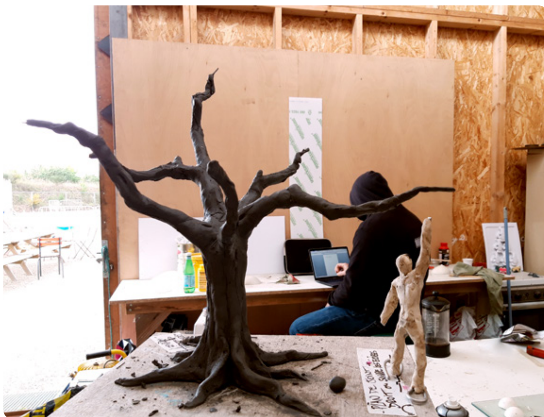
Maquette, mars 2021