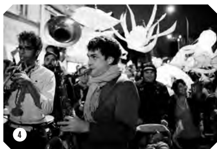
5. Banquet de fin de parade