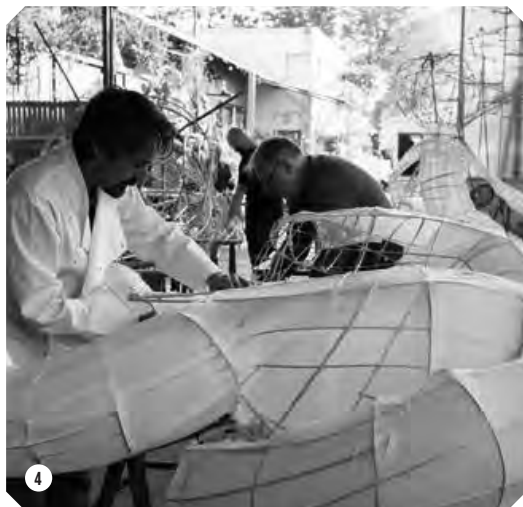
1. Atelier lanterne au foyer Edouard Finck