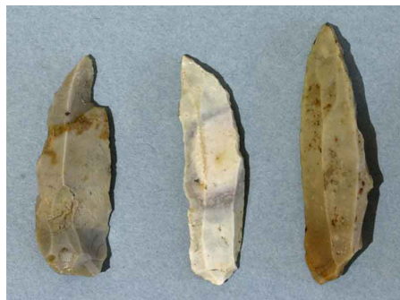
Couteaux à dos, type chatelperron, Silex, Paléolithique supérieur (aurignacien), Mellecey, hameau de Germolles, grotte de la Verpillière.

Dès le Paléolithique, on peut observer que l'Homme s'approprie les matériaux qui l'entourent. Pierre et os sont transformés afin d'en faire des outils qui améliorent ses conditions de vie et d'adaptation à son milieu.