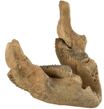
Mâchoire de mammoth, Os, Époque paléolithique, La Saône.

L'Homme fait partie de la nature. Mammifère prédateur, il vit grâce aux ressources que lui offre son environnement. Il vit de la cueillette et de la chasse, habite dans des grottes. Il côtoie des animaux sauvages et imposants, comme en témoignent les ossements retrouvés.