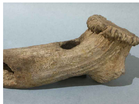
Pioche, Bois de cervidé, Époque néolithique, Sainte Croix (S.-et-L.), berges de la Saône