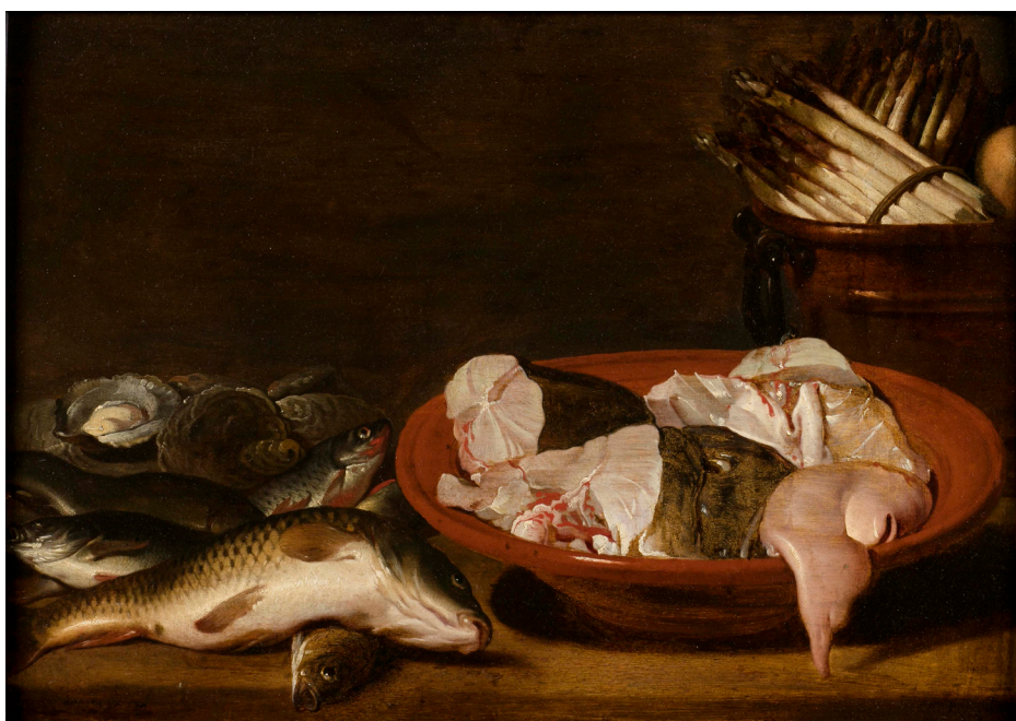
Pieter VAN DER PLAS, Nature morte de poissons vers 1636

L'art de la nature morte est à la fois une recherche esthétique, par le travail des formes, des textures, de la lumière et des couleurs, une réflexion spirituelle ou morale, par la représentation d'éléments codifiés et un manifeste de la virtuosité du peintre.