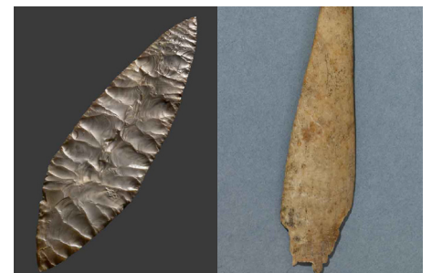
Pointe de Volgu, Silex, 22 e millénaire av. J.-C., Volgu, commune de Rigny-sur-Arroux.