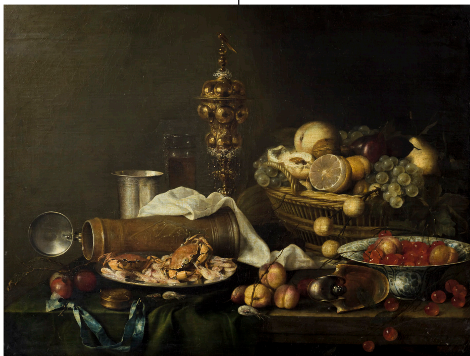
Jan DAVIDSZ DE HEEM, Nature morte avec Ciboire, Chope en grès, Fruits et Crabes, 1647