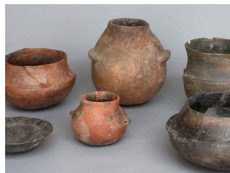
Vases, Terre cuite, Néolithique moyen, culture du chasséen, Chassey-le-Camp