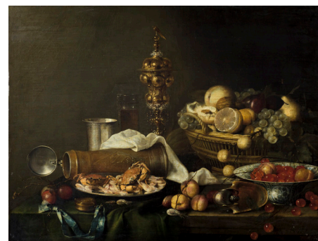
Jan DAVIDSZ DE HEEM, Nature morte avec Ciboire, Chope en grès, Fruits et Crabes , 1647