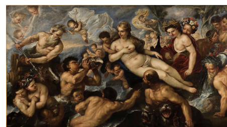
Luca Giordano, Le retour de Perséphone , Vers 1660-1665