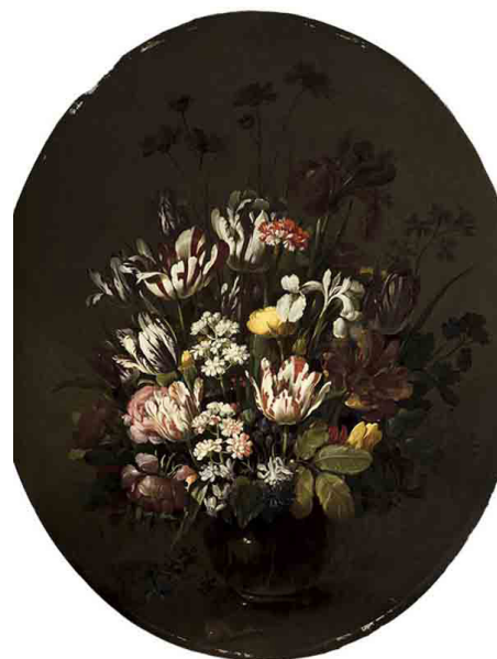
Hans BOLLONGIER, Vase de Fleurs , 1640

Dans la première moitié du XVI e siècle, les Pays du Nord participent à la diversification des espèces florales qui s'intensifie après 1550. Plusieurs centaines d'espèces apparaissent et, parmi elles, la tulipe qui connaît un engouement sans précédent en Hollande jusqu'au milieu du XVII e siècle.