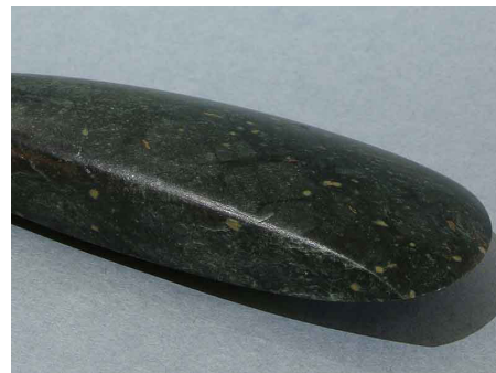
Hache, Pierre polie, Époque néolithique, Asnières (Ain), la Saône