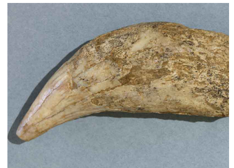
Dent de lion des cavernes, Ivoire, Époque paléolithique, Mellecey, hameau de Germolles, grotte de la Verpillière.

Dès le Paléolithique, on peut observer que l'Homme s'approprie les matériaux qui l'entourent. Pierre et os sont transformés afin d'en faire des outils qui améliorent ses conditions de vie et d'adaptation à son milieu.