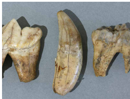
Dents d'ours des cavernes, Ivoire, Époque paléolithique, Mellecey, hameau de Germolles, grotte de la Verpillière.