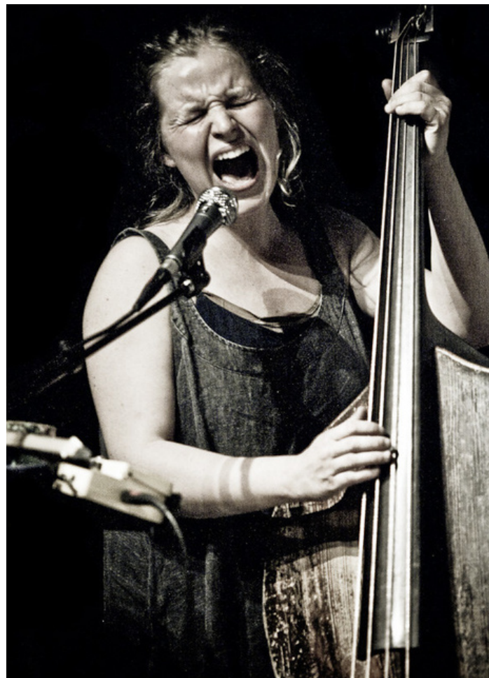
composition musique