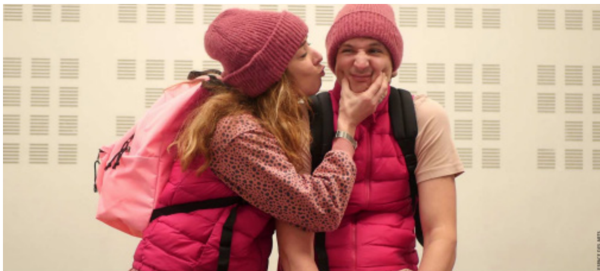
Renversante, une production de l'Espace des arts