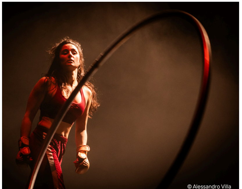
© Alessandro Villa Lontano; Marica; 2022