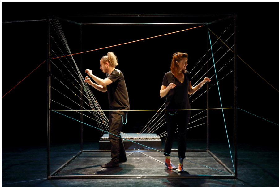
La structure musicale: le Filophone © Guillaume Serres

Le « Filophone » est une structure musicale spécifiquement conçue et réalisée pour le spectacle Des yeux pour te regarder . Sur la structure, plusieurs fils sont reliés à un « playtron », un contrôleur midi capable d'assigner un son à n'importe lequel de ces fils.