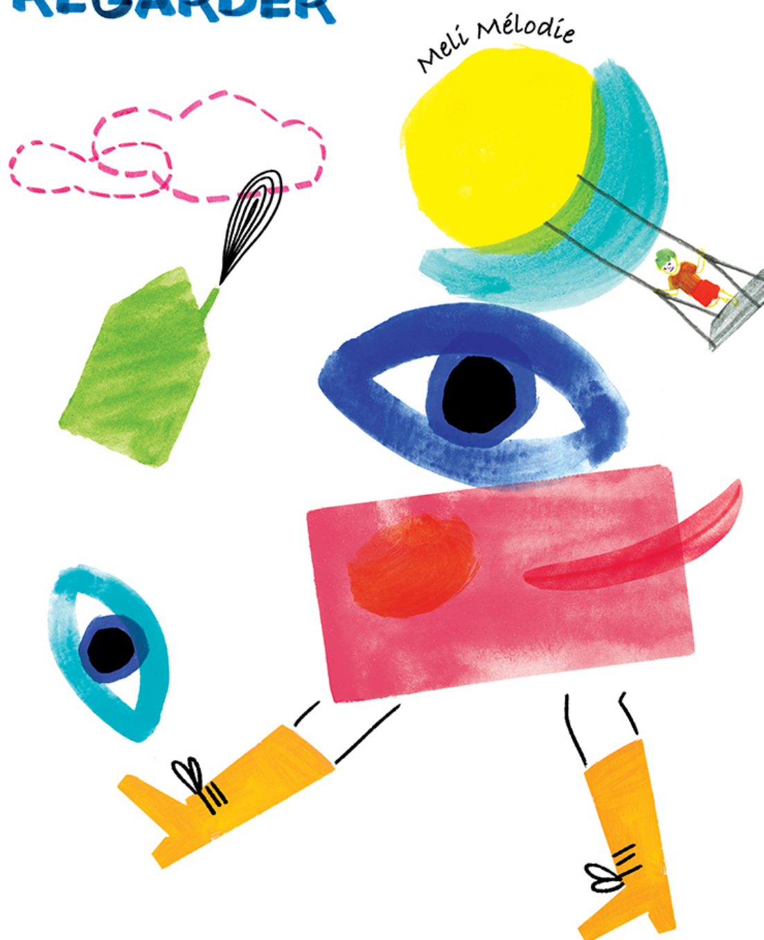
illustration et design affiche : Elis Wilk