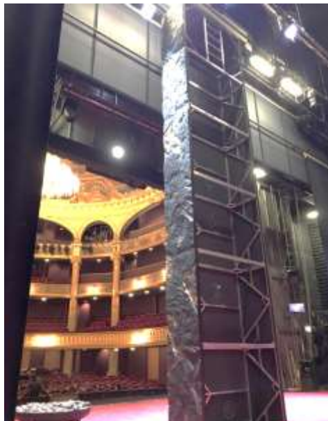
Photo de l'arrière du pilier central du décor d'Iphigénie en Tauride – vue depuis côté cour

Le régisseur général est chargé de collecter toutes les informations artistiques et techniques qu'il met en forme dans un « dossier de production ». Ce dossier constitue la mémoire intégrale d'un spectacle. On y trouve tous les éléments qui permettront la reconstitution exacte du spectacle en cas de tournées ou de reprises. Des "relevés" photo du spectacle accompagnés de plans et de conduites (un pas à pas minuté) pour les lumières, les décors, les accessoires, les costumes, maquillages, ou plus généralement la mise en scène sont minutieusement récoltés et classés. Ce travail représente au moins 1 mois de travail.