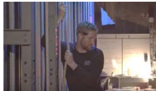
Equipe technique du Grand Théâtre d'Angers au manoeuvre des perches (Iphigénie en Tauride - 2020)

→ Découvrez le métier de machiniste à travers quatre extraits du webdocumentaire