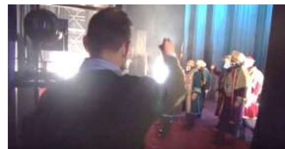
Le chef de chœur d'Angers Nantes Opéra dirige le chœur depuis les coulisses lors des répétitions d'Iphigénie en

Comment le chef communique-t-il avec le chœur ? Via une communication non verbale qui sert à donner le départ et à indiquer le tempo ou les nuances. Il se sert donc de ses mains (on appelle cela la chironomie ), mais également de sa posture et de son regard pour insuffler l'énergie au chœur... En ce sens, le chef de chœur est le miroir des choristes.