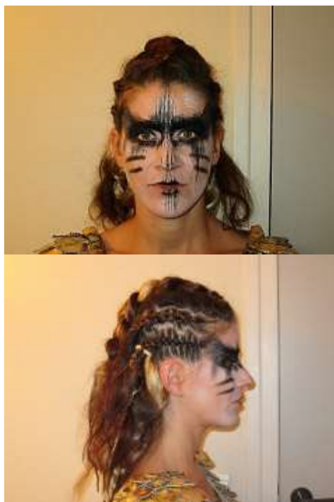
extrait des consignes de maquillage pour l'une des danseuses d'Iphigénie en Tauride

Le maquilleur et le perruquier (métier très rare en France) traduisent, avec fond de teint, mascara, cheveux synthétiques, postiches, mais aussi perruques en papier, en cuir... les personnalités et le style des rôles. Il ou elle travaille au service du costumier et du metteur en scène d'après croquis et maquettes, où des prototypes sont alors réalisés avant l'objet fini. L'équipe doit être polyvalente : coiffeur, perruquier, maquilleur et ont des compétences en réalisation d'effets spéciaux (fausse cicatrice, faux sang, faux crâne...). A titre indicatif, une perruque peut être fabriquée en 10 jours, elle est ensuite adaptée au comédien ou au chanteur avec une coupe sur-mesure !