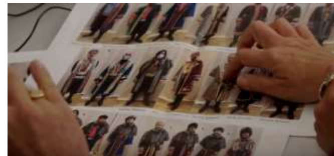
Étape de création des costumes du chœur - Iphigénie en Tauride - 2020

4/ Les habilleurs s'occuperont ensuite de tout prévoir pour les changements rapides entre deux scènes et d'entretenir les costumes.