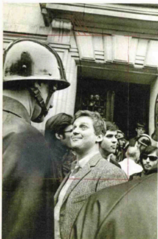
Daniel Cohn-Bendit face à un CRS devant la Sorbonne, le 6 mai 1968