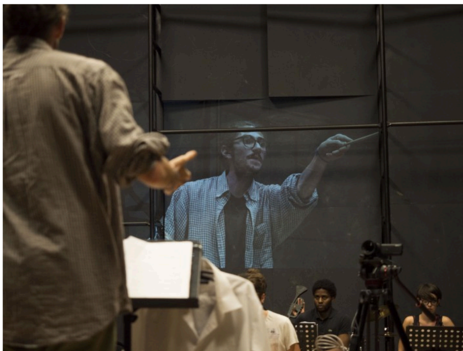
"Prova d'Orchestra"