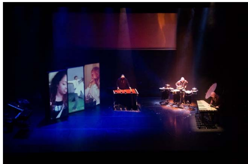
Visuels extraits du concert augmenté NOUS