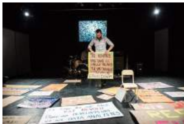
Photographie du spectacle « Contrôle » de M. Marzouki et P. Maurin