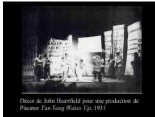
Décor de John Heartfield pour une production de Piscator Tan Yang Wakes Up , 1934

Le théâtre documentaire présente des événements politiques, sociaux, économiques, culturels, etc. Il s'agit d'un théâtre qui se base sur des faits réels et qui a pour but de sensibiliser le public sur des problèmes sociaux, politiques, etc. Il s'agit d'un théâtre qui se base sur des faits réels et qui a pour but de sensibiliser le public sur des problèmes sociaux, politiques, etc.