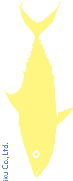
Design graphique © Cécile Le Trung a-l-oeuvre.fr 2026