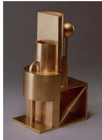
10 Composition pour arrangement floral Toyochika Takamura 1926 Collection particulière