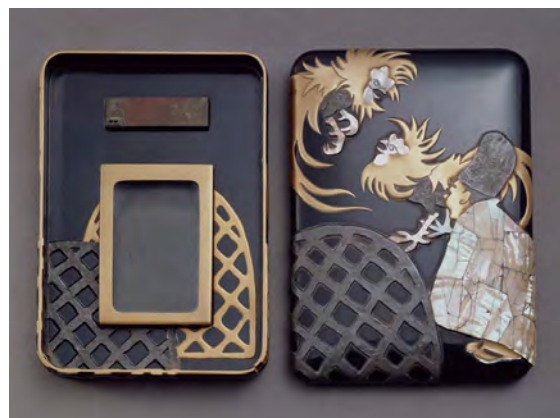
3 Ecritoire en laque maki-e à décor de combat de coqs Kokō Sugibayashi 1906 © Sakura City Museum of Art