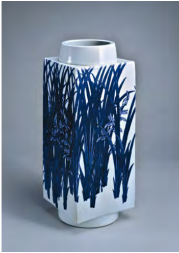
7 Vase parallélépipédique à décor d'orchidées, bleu sur fond blanc Rokubei Kiyomizu V 1924