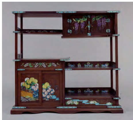
1 Etagère décorative ornée d'émaux Nanaho Inaba I 1904