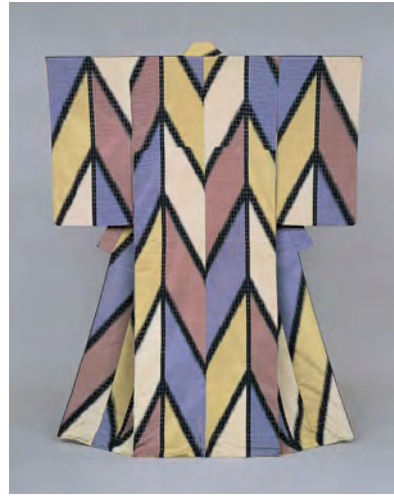
8 Kimono en ikat de crêpe de soie à motif traditionnel d'empenne de flèche Anonyme Ere Taishô (1912-1926) – début de l'ère Shôwa (1926-1989)