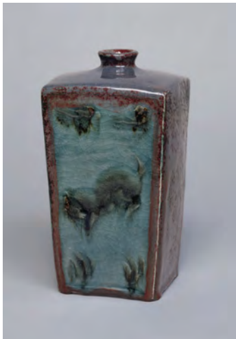
9 Vase « Crépuscule au bord de l'étang » Yaichi Kusube 1920