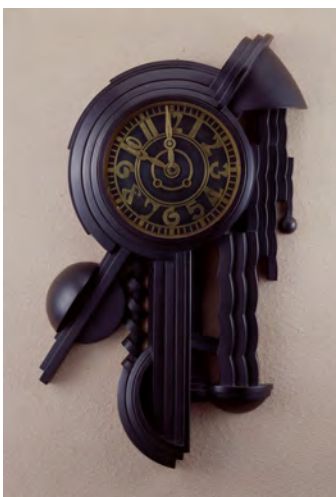
11 Horloge murale Haruji Naitô 1927