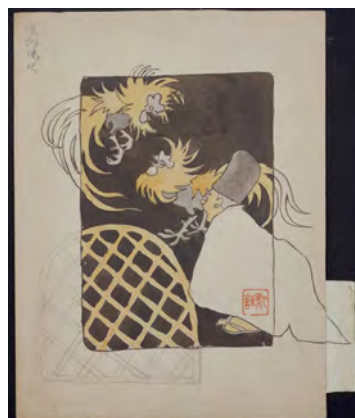
4 Combat de coqs (dessin) Asai Chū 1906