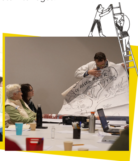
Ateliers préparatoires