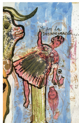
«Yo soy la desintegración.», extrait du journal intime de Frida Kahlo Museo Frida Kahlo