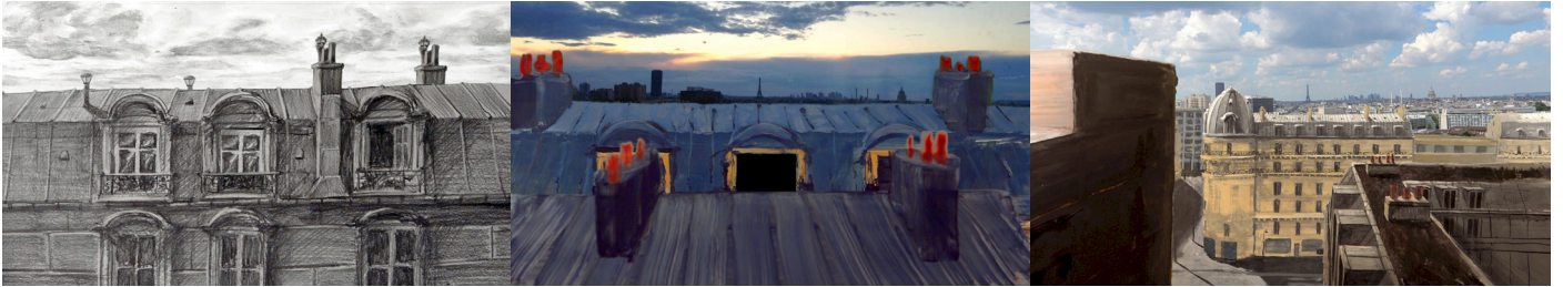
Dessin et Peintures de recherche - extérieur chambre