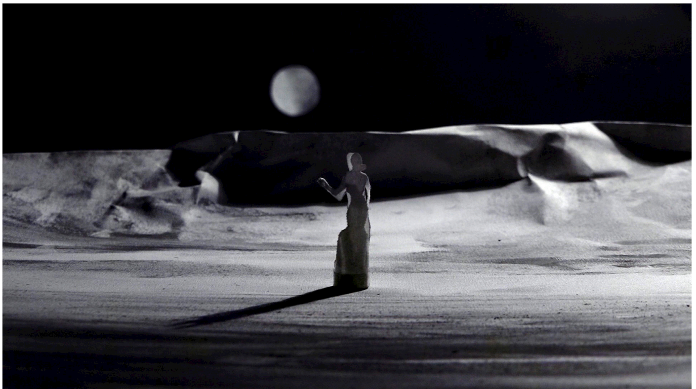
Décors et marionnettes en papier

Le spectacle commence par la fin du film et remonte le fil de son histoire. Les scènes se succèdent sans avoir à première vue un lien narratif précis. Au début, un couple apparaît à l'écran. À la fin du spectacle, ils finiront seuls, chacun de leur côté. Le public peut laisser libre court à son interprétation du scénario. En toute fin de spectacle, la projection du film remet en perspective toutes les scènes, révélant les choix tant picturaux que scénaristiques pris par les artistes. Une intimité s'est tissée entre les spectateurs et le film car ils en connaissent le parcours, du premier trait de crayon, du premier coup de gomme jusqu'au générique de fin.