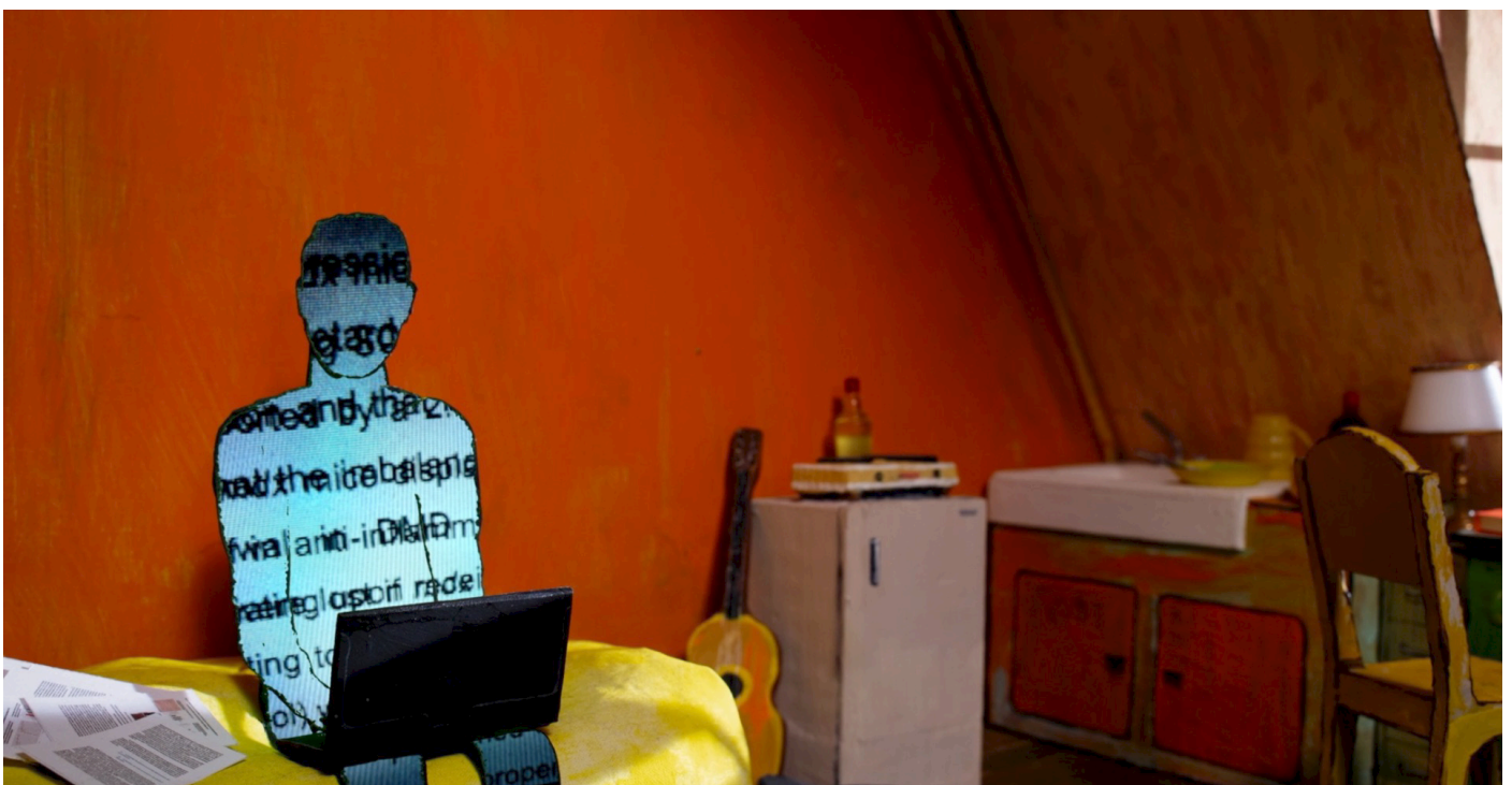
Marionnette en papier et décors.

Il s'adresse à tous les publics et peut être proposé à différents festivals de film d'animation et de court métrage, chaînes de télévision ou encore plateformes internet.