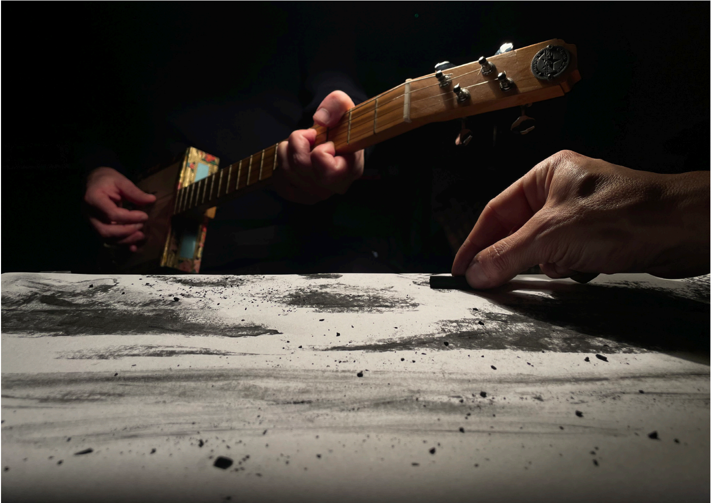
Extrait du spectacle

Le film nous parle de notre capacité à renouer avec le sensible et l'expression de nos émotions.