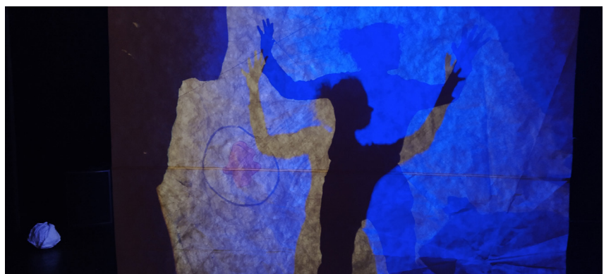
Tests et recherches - Ombres et Couleur LED