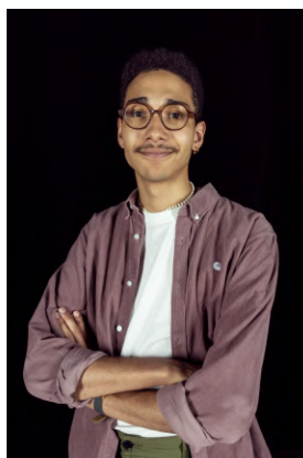
Axel Ravier L'Archéologue

Depuis juin 2020, il présente le podcast Featuring et préside La Récré , où il organise des débats centrés sur le monde du rap où des chroniqueurs du monde du rap, notamment de médias, reçoivent une ou plusieurs personnalités en lien avec le thème abordé.